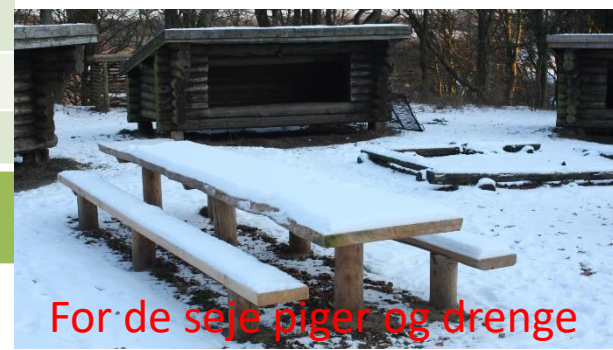
For de seje piger og drenge