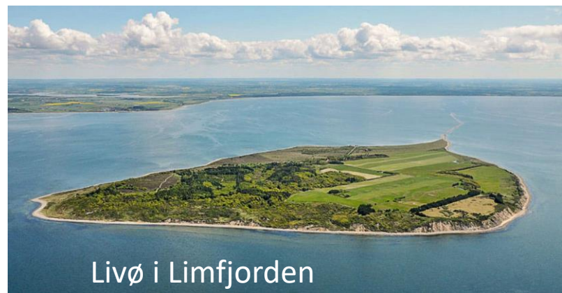
Livø i Limfjorden

Detaljer om tider, tilmelding, pakkeliste mv kommer, når vi nærmer os.